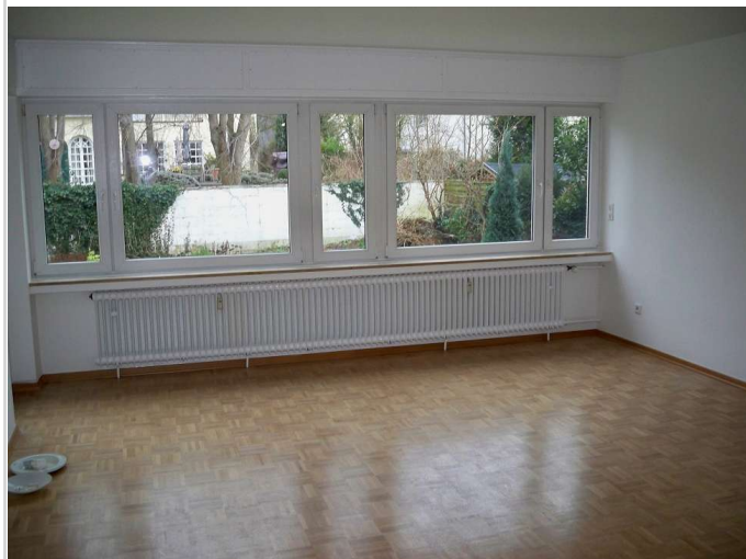
03 - Zimmer