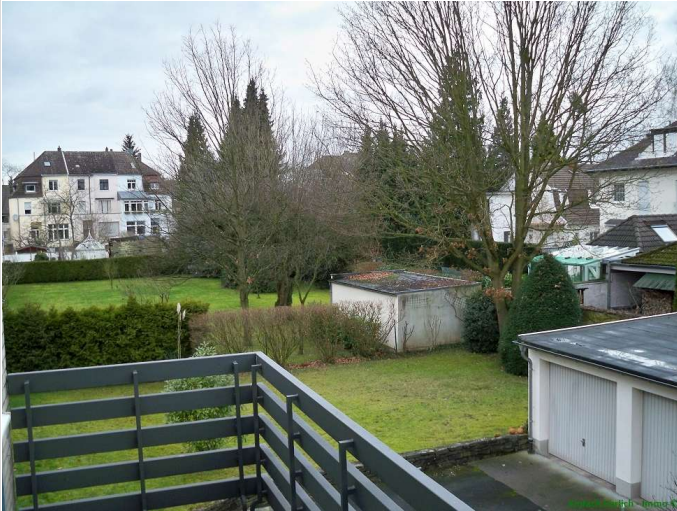
09 - Aussicht Balkon