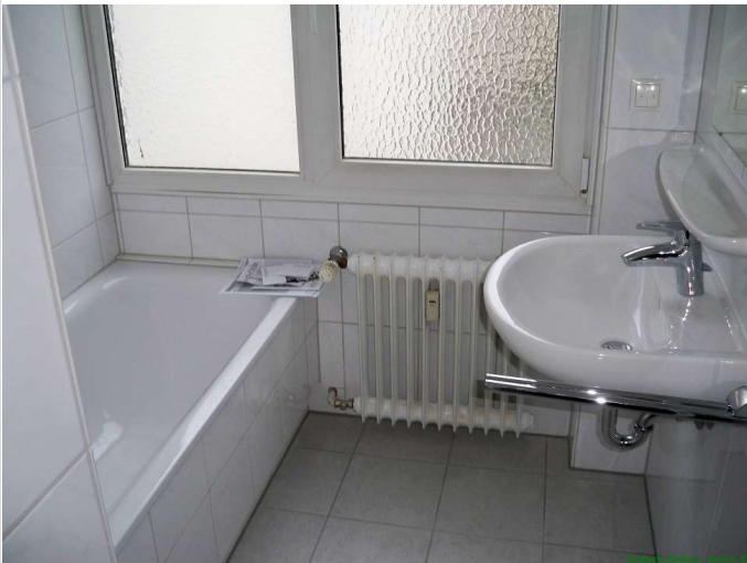
07 - Badezimmer