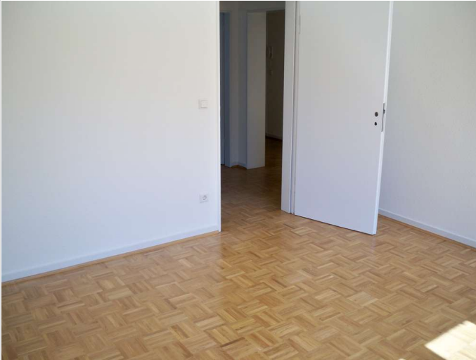
05 - Zimmer