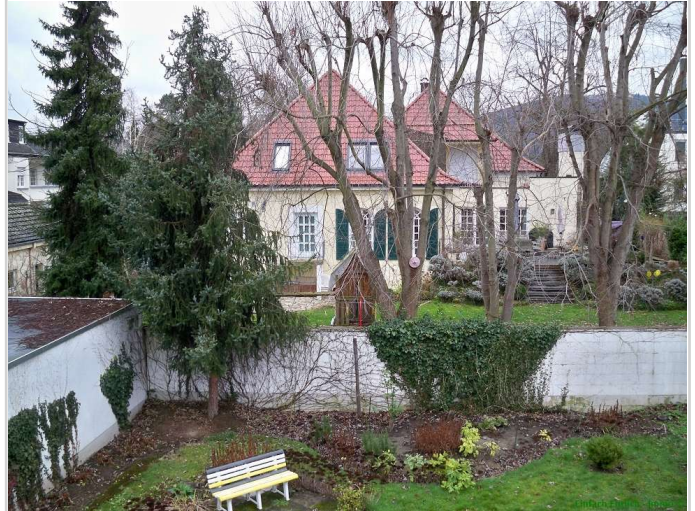
10 - Aussicht Balkon