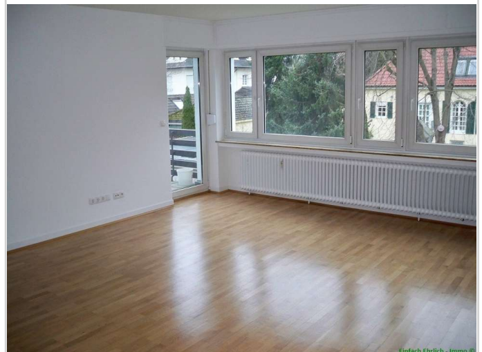
04 - Zimmer