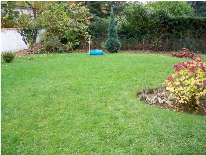
11 - Garten