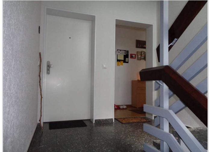
02 - Treppenhaus