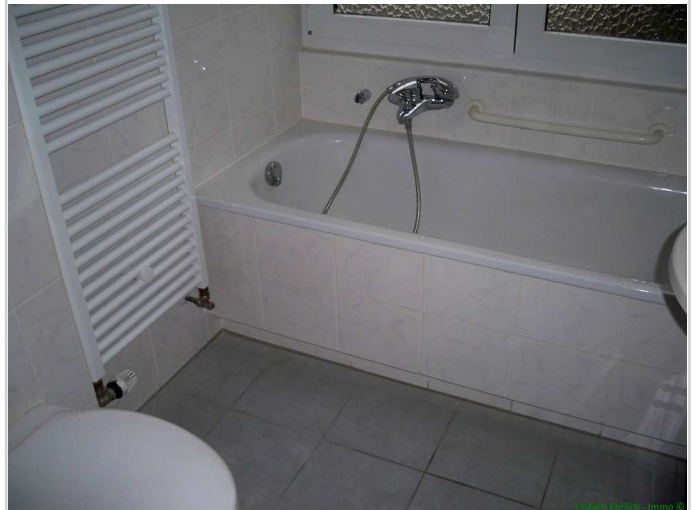
08 - Badezimmer