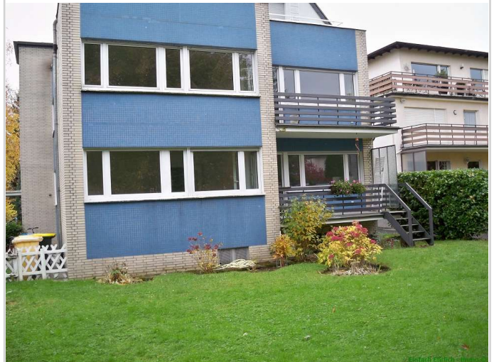
12 - Rückansicht