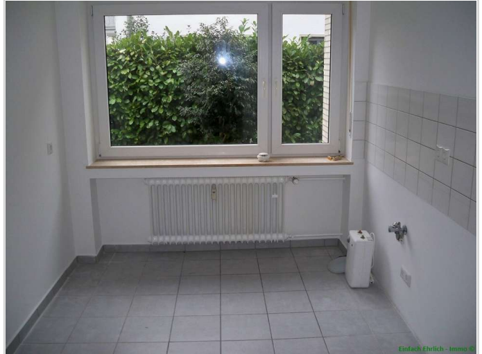
06 - Küche