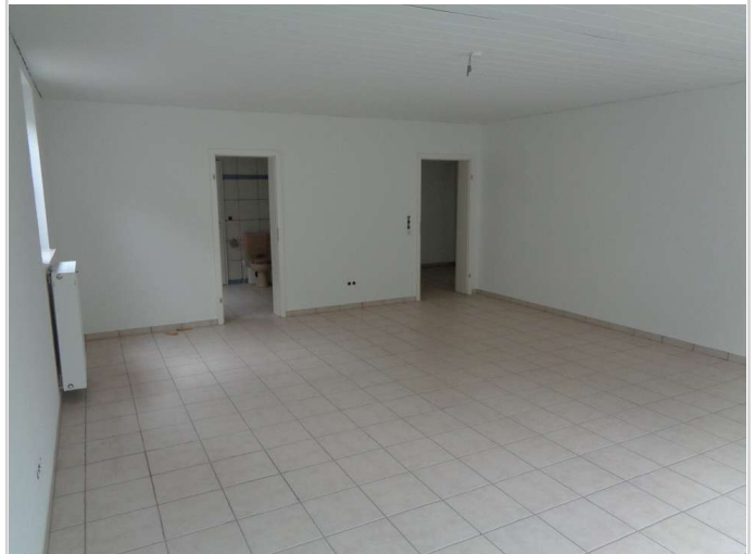
09 - Zimmer Souterrain rechts