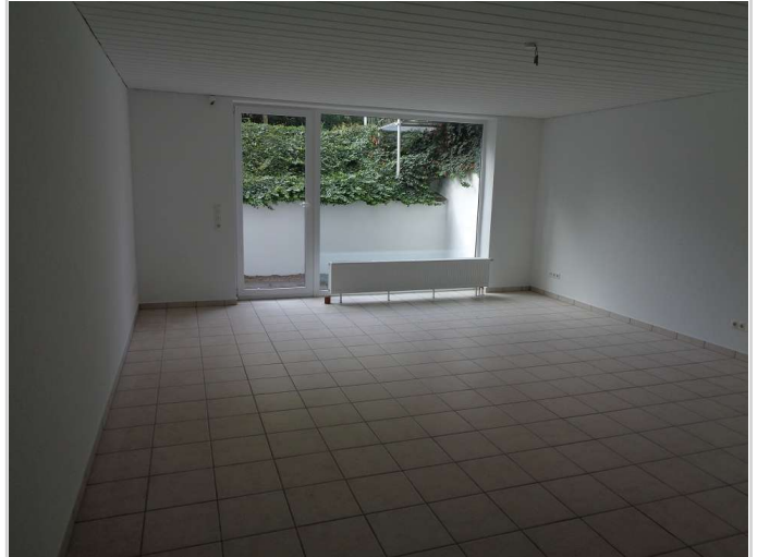
07 - Zimmer Souterrain rechts