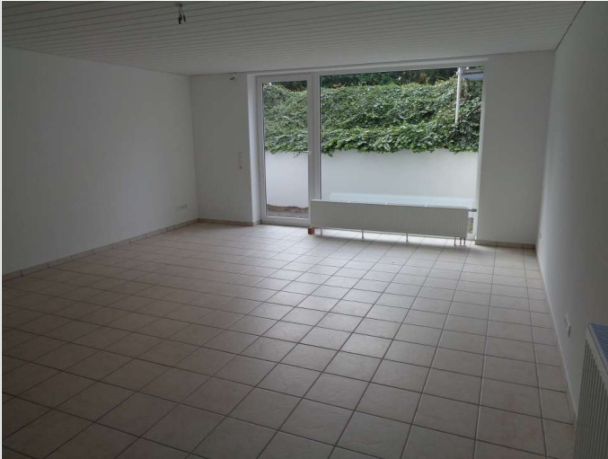
10 - Zimmer Souterrain rechts

Miet-/Kaufobjekt: Miete Büro-/Praxisfläche: 93,00 m² Miete pro Monat: 650,00 EUR