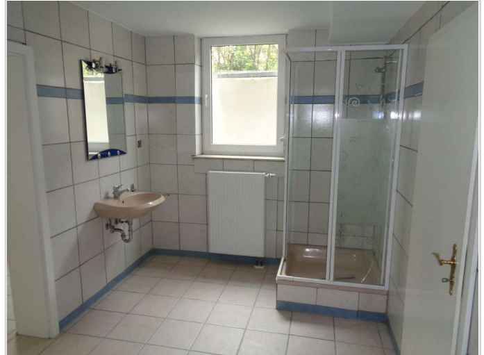
11 - Badezimmer Souterrain