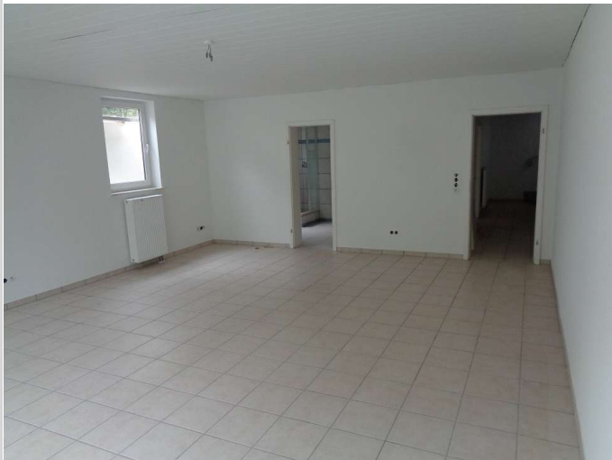
08 - Zimmer Souterrain rechts