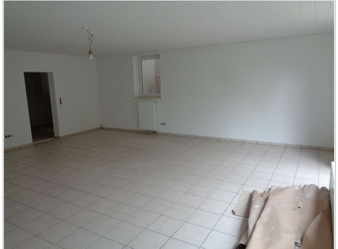
03 - Zimmer Souterrain links 2