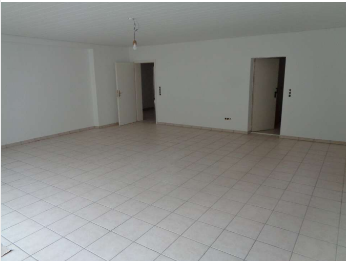
04 - Zimmer Souterrain links 3