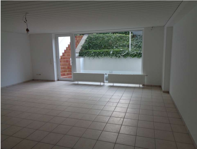
02 - Zimmer Souterrain links 1

Miet-/Kaufobjekt: Miete Büro-/Praxisfläche: 93,00 m² Miete pro Monat: 650,00 EUR