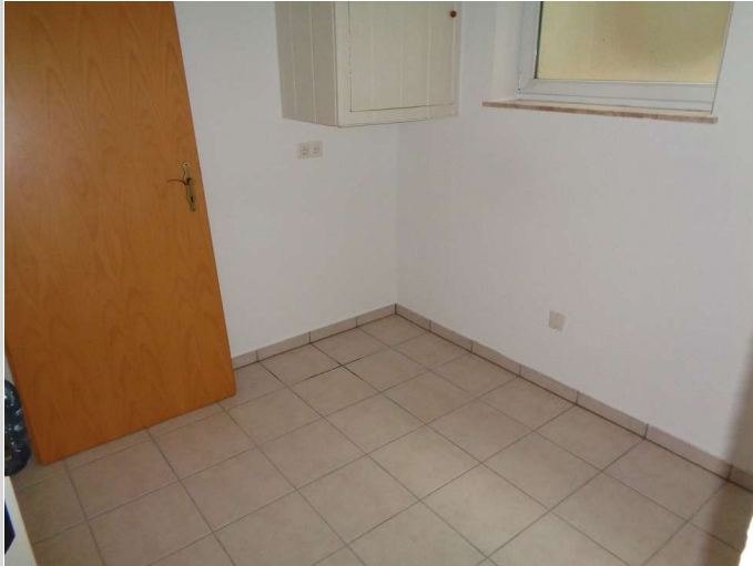
06 - Teeküche Souterrain 1

Miet-/Kaufobjekt: Miete Büro-/Praxisfläche: 93,00 m² Miete pro Monat: 650,00 EUR