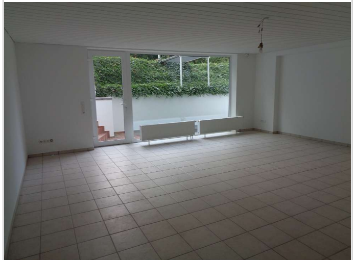
05 - Zimmer Souterrain links 4